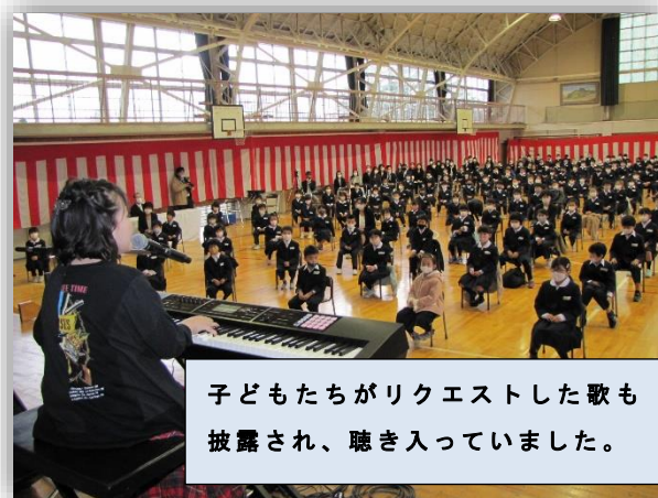
子どもたちがリクエストした歌も披露され、聴き入っていました。